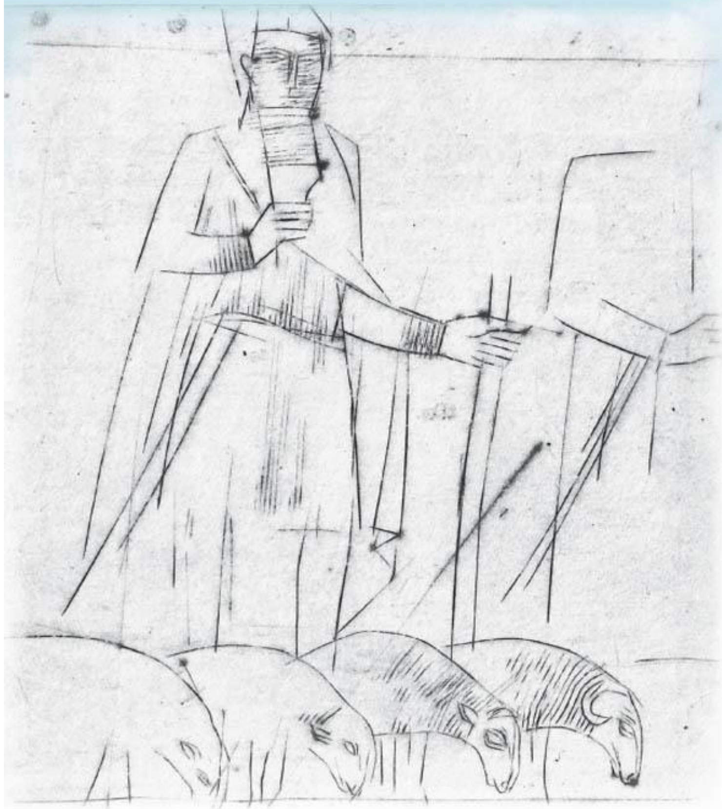
Bogdan Topor, Psalm 23, miedzioryt.